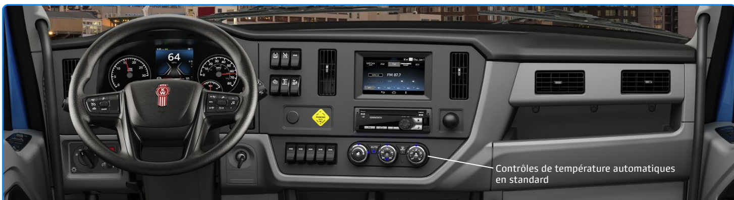
Contrôles de température automatiques en standard

La transmission automatique TX-8 à 8 vitesses de PACCAR, en standard sur les T180 et T280, procure un contrôle de véhicule intuitif et une performance supérieure pour les chauffeurs de tous les niveaux d'expérience. Avec la meilleure puissance massive de sa catégorie, il rehausse également votre charge utile et votre profitabilité.