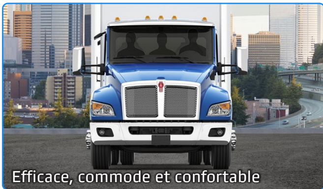
Efficace, commode et confortable

Les nouveaux modèles de classe moyenne de Kenworth ont été optimisés pour une efficacité, une commodité et un contrôle encore meilleurs pour un camion non-CDL. Assez d'espace pour une équipe de trois ainsi que tout l'équipement – confortablement. Mettant en valeur les mêmes détails de première qualité que vous trouveriez dans les modèles robustes les Meilleurs au Monde.