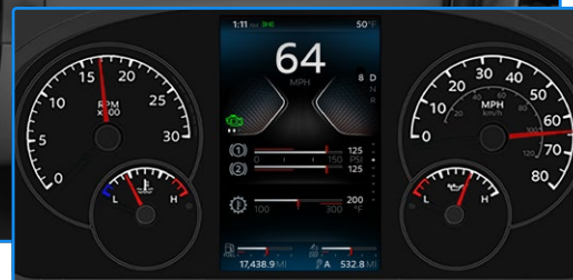
Tableau de bord standard avec affichage numérique de 17,8 cm

Un nouvel affichage numérique à haute définition de 17,8 cm personnalisable, le meilleur de sa catégorie, utilise une technologie de pointe afin de fournir au chauffeur de l'information intuitive, efficace et nécessitant un minimum d'attention, concernant les conditions critiques d'opération. Établissez les spécifications SmartWheel® de Kenworth de façon à accéder tactilement à tous vos contrôles.